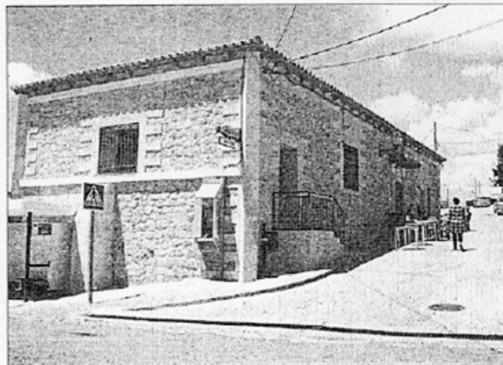
Imagen de la renovada fachada del bar Las Escuelas.