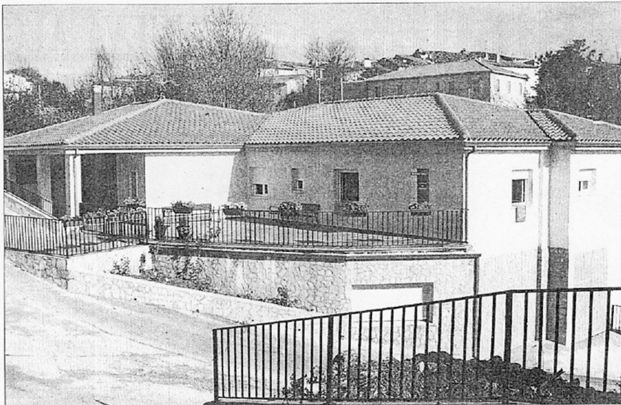
La vivienda de mayores de la localidad da cabida a un total de 10 usuarios que residen a diario en ella.

A lo largo del año pasado, el Ayuntamiento de La Toba ha venido desarrollando obras en diferentes entornos de la localidad. Gracias a la ayuda de ADEL Sierra Norte de Guadalajara, se ha mejorado la zona de descanso existente entre el lavadero y el frontón y el acondicionamiento superficial del